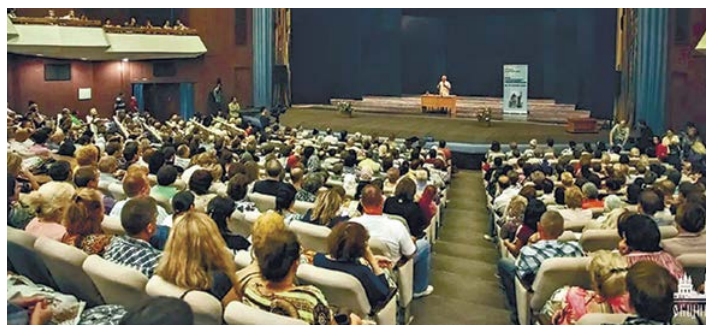
Публичные лекции А.И. Осипова неизменно собирают множество слушателей.

Да, способно, но обязательно. Апостол Пётр писал: покажите в вере вашей добродетель, в добродетели рассудительность (2 Петр 1:5).