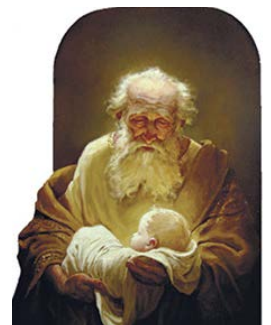
Симеон и Иисус. Андрей Шишкин. 2012

В день Сретения Церковь празднует не просто встречу старца со Христом, а встречу всего человечества с долгожданным Спасителем.