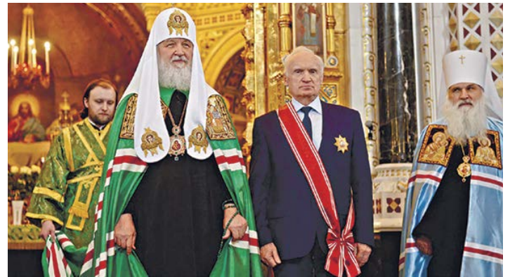
Патриарх Кирилл награждает А.И. Осипова орденом святителя Макария, митрополита Московского, I степени в честь 80-летия со дня рождения. 2018

В русском языке слово «любовь» имеет большое