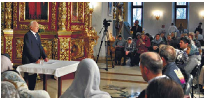
Александрo-Невский храм в Подмоскoвье, 2019.

Ясно же, что, давая, можно одного сделать тунеядцем, а другого спасти от беды и смерти. Есть ли критерий, исходя из которого, можно было бы избежать ошибки? Думается, что кроме рассудительности, исходящей из закона: суд без милости не оказавшему милости; милость превозносится над судом (Иак 2:13), едва ли можно найти что-то большее. И когда трудно решить, то лучше ошибиться, оказав милость, нежели погрешить наоборот. То есть основным во всех подобных рассуждениях должно оставаться благожелательное отношение к человеку, каким бы он ни был. Не видишь оснований дать 100 или 60, или 30 (см. Мк 4:8), дай хотя бы минимум.