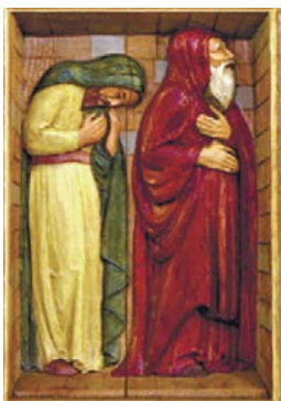
Мытарь и фарисей

Это первое из четырех воскресных, предшествующих началу Великого поста (на церковнославянском языке «неделя» означает «воскресенье»). Каждая из четырех недель посвящена определенному моменту из Священного Писания. Первая - о мытаре и фарисее. В этот воскресный день на литургии читается фрагмент Евангелия от Луки (18:10-14): мытарь олицетворяет собою грешника, обремененного грузом своих грехов, но искренне кающегося в них, а фарисей - человека внешне благочестивого, но не видящего своих грехов, мнящего себя праведным и превозносящегося над грешниками.