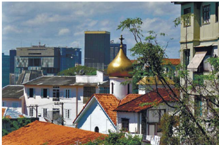
«Русь тропическая». Вид на храм святой Зинаиды в Рио-де-Жанейро с холма Санта-Тереза