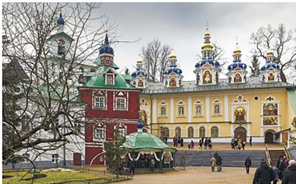
Свято-Успенский Псково-Печерский монастырь. Успенский пещерный храм

Нет, наверное, необходимости, рассказывать истории Псково-Печерского монастыря: эта обитель известна многими незабвенными заслугами перед Отечеством и Православной церковью, как, впрочем, и о знаменитых пещерах монастыря, в которых погребались умершие иноки и лица различного состояния, даже не принадлежащие к данной обители, которые однако сделали вклад или оказали какую-либо услугу и благоденствие этому святому месту.