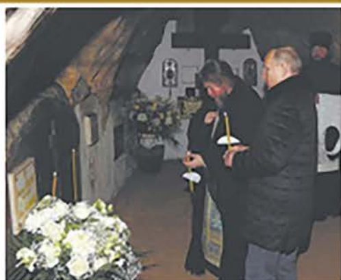
Президент России В.В. Путин с митрополитом Тихоновым в Псково-Печерском монастыре

Чепкирина, убитого 20 ноября 1700 г. за «свейским (шведским) рубежом» под Новым Городом (Нейгаузенем).