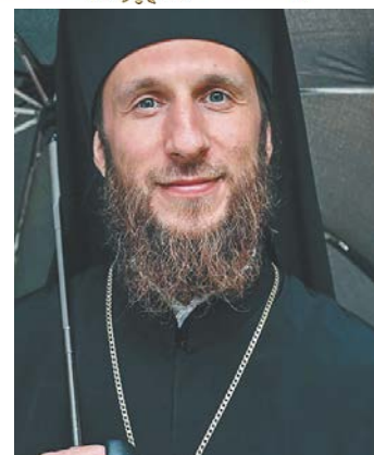
Архимандрит Симеон (Томачинский)

И даже если Он нам посылает какие-то страдания, порой необъяснимые, не вмещающиеся в голову, любящий Господь