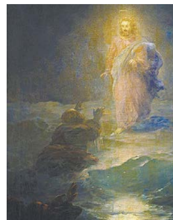
«Хождение по водам». Иван Айвазовский. 1888. Государственный музей истории религии

Человек, идя за Христом, все равно должен так или иначе проследовать тем духовным путем, который указан в Евангелии и на котором и Павел был Савлом, и Пётр прошел через отречение. Вот мы в порыве и бросаемся ко Христу по воде, и тут же в сомнении начинаем идти ко дну с воплем: «Господи, спаси, мы тонем!» И это все естественно в нашей жизни. Но, к счастью, есть надежда хотя бы к концу ее обрести веру и верность. Надежда, которая держится на христианском памятовании: спасение утопающих, вопреки расхожему выражению, дело