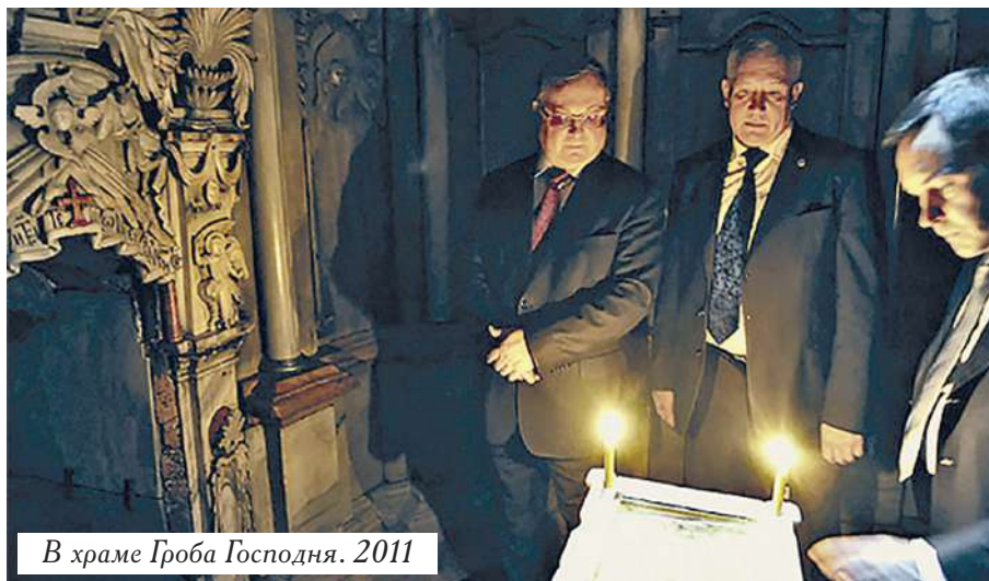
В храме Гроба Господня. 2011

По рассказам мамы, начиная с января 42-го года они во время налетов уже не бегали в бомбоубежище. Это