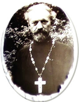
Протоиерей Павел Успенский

Подлинный героизм в годы войны проявило столичное