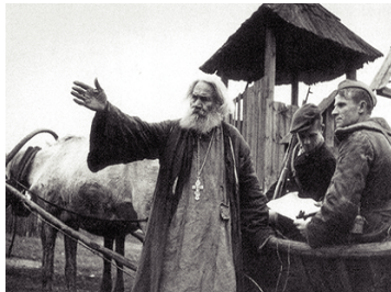
На партизанских тропах Белоруссии