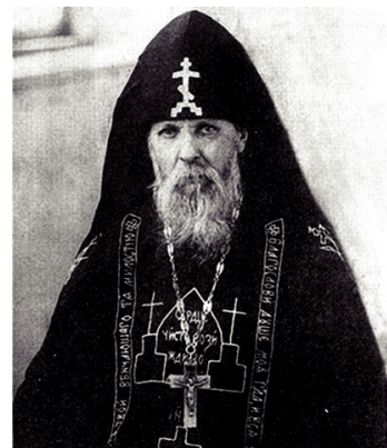
Преподобный Серафим Вырицкий

Тем временем пропагандистские действия немецкого руководства по открытию храмов не могли не вызвать соответствующей ответной реакции Сталина. К этому его побуждали также и те движения за открытие церквей, которые начались в СССР уже в первые месяцы войны. В городах и селах собирались сходки верующих, на которых избирали исполнительные органы и уполномоченных по ходатайствам об открытии храмов. На селе такие собрания нередко возглавляли председатели колхозов, которые собирали подписи за открытие церковных зданий и затем сами выступали ходатаями перед исполнительными органами. Нередко бывало, что работники исполкомов разного уровня благосклонно относились к ходатайствам верующих и в рамках