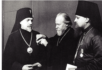
Митрополит Николай вручает медали «За оборону Москвы»

жертвований и лома цветных металлов на военные нужды. Всего за годы войны прихожане Ильинской церкви собрали 185 тысяч рублей.