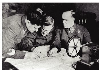
Соколовский, Булганин и Жуков во время битвы под Москвой

Все эти процессы побудили советское руководство официально разрешить открывать церкви на территории, не оккупированной немцами. Преследования духовенства прекратились. Священники, находившиеся в лагерях, были возвращены и стали настоятелями вновь открытых храмов.