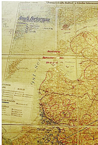
Подлинник плана нападения на СССР Барбаросса. Фрагмент

ми стали читать специальную молитву об избавлении от врагов.