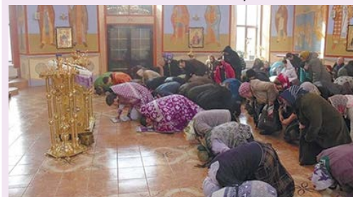
«Один земной поклон - одна пуля мимо советского солдата» Протоиерей Андрей Ткачев

Святейший Патриарх Московский и всея Руси Кирилл, 25 сентября 2022 года