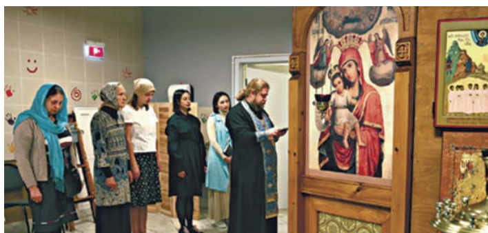
Молебен в домовом храме в честь иконы Богородицы «Милующая» при Морозовской детской клинической больнице. В храме регулярно проходят богослужения. На месте постоянно дежурит кто-то, к кому можно обратиться, оставить записку, передать просьбу священнику. В прошлом году на территории больницы завершилось строительство большой церкви в честь Покрова Пресвятой Богородицы