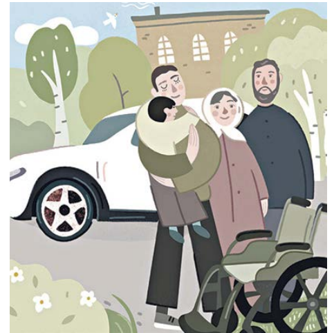
Рисунок Ксении Вязовой

Вышел я от батюшки. А во двор собора крутая иномарка въезжает. Получилось, что вот он я - в подрыснике посреди двора стою. И «крузак» на стоянке припарковывается. Выходит из него сын просителей. Потом папа его. Сын к задней двери подошел и нежно-нежно так, за руку маму взяв, помог ей из машины выйти. Потом из багажника инвалидную коляску вытащил. И уж в конце мальчика лет девяти из салона достал, на руках понес и в коляску посадил. Я как это увидел, такой дрянью несусветной себя почувствовал, не приведи Господь. Подбежал к ним, представился и предложил ребенка на коляске в храм на причастие подвезти. Он меня увидел, на меня немощной своей рукой показывает и спрашивает у бабушки, коряво и еле выговари-