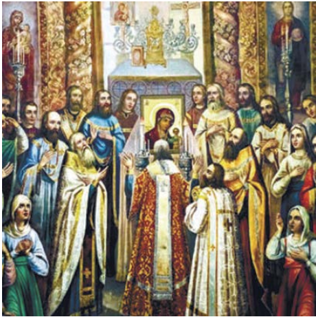
Торжество Православия.