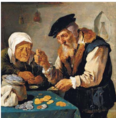
Аллегория жадности. Давид Тенирс Младший. 1660

Пусть это слушает скупец, пусть слушает тот, кто носит имя христианина, что он не может одновременно служить богатству и Христу. Впрочем, Он не сказал о том, кто имеет богатство, а о том, кто является рабом богатства. Действительно, кто является рабом богатства, тот как раб сохраняет богатство, а кто сбросил с себя ярмо богатства, тот раздает его как господин». ф.