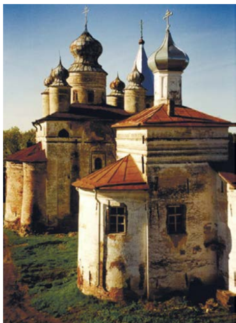
Троицкий Зеленецкий мужской монастырь

Именно здесь, в Крюче, дошли до глубины души и нашли отклик в сердце известные строки из Псалтири: «В память вечную будет праведник... Готово сердце его уповати на Господа... (Пс. 111, 6,8)