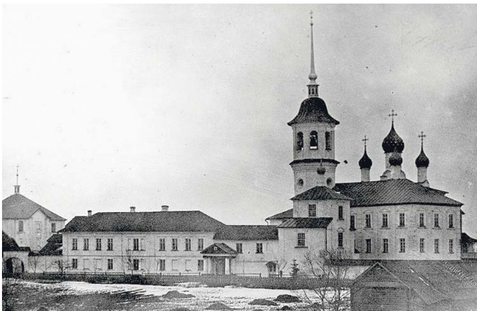
Троице-Сергиев монастырь. Великие Луки

Хранит Господь вся кости их, ни единая от них сокрушится (Пс. 33, 21)».