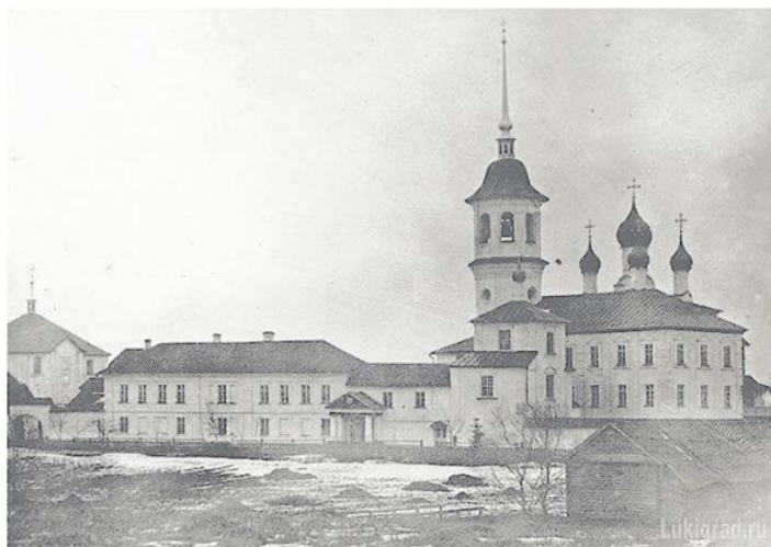
Троице-Сергиев монастырь. Великие Луки

и обратиться ко Христу. Для укрепления в подвигах моих Господь Бог, в великой и неизреченной милости Своей, нередко посылал мне чудные сновидения. Так, однажды — помнится мне — вижу я невыразимо величественное здание необыкновенной красоты, а в нем — двое светлых юношей поют и читают гимны Честному Животворящему Кресту