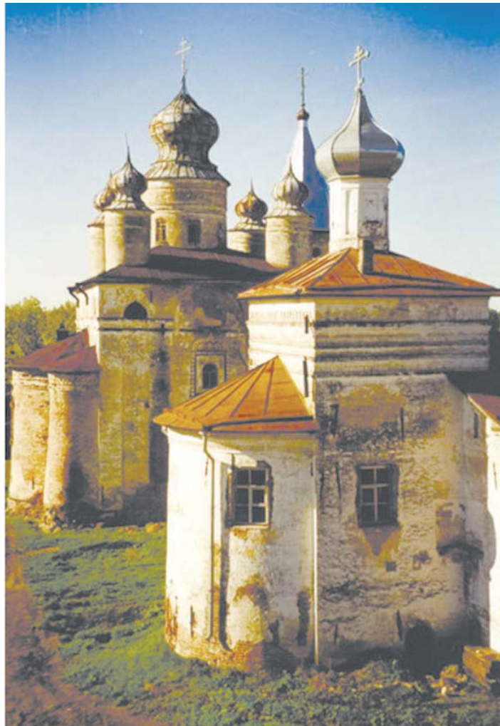
Троицкий Зеленецкий мужской монастырь