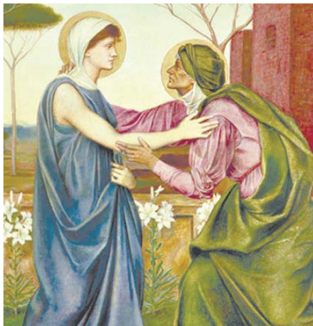
Приветствие. Эвелин Де Морган, 1883

По внушению Святого Духа еще во чреве матери Иоанн узнал своего Господа, когда беременная Мария пришла в гости к беременной Елисавете: Когда Елисавета услышала приветствие Марии, взвыл младенец во чреве ее; и Елисавета исполнилась Святого Духа, и вос-