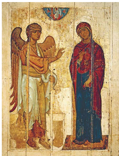
Устюжское Благовещение. Новгород. X век

тексту. Там есть пророчества о почитании Богородицы. Это слова Архангела Гавриила, который приносит Деве Марии весть о том, что Она будет матерью Спасителя. Короткая фраза «Благословенна Ты между женами» (Лк 1:28). Благословенна - означает прославлена. И Архангел произносит это не от себя, он всего лишь посланник Божий. И Богородица, встречаясь со Своей родственницей Елисаветой, прямо говорит, что Бог сделал Её великой и люди прославят Её (Лк 1:48-49). Поэтому Церковь всегда отвечала тем, кто, ссылаясь на Евангелие, отказывался почитать Богородицу: тем самым вы отказываетесь исполнять то, к чему призывает христиан Евангелие: почитать Божию Матерь.