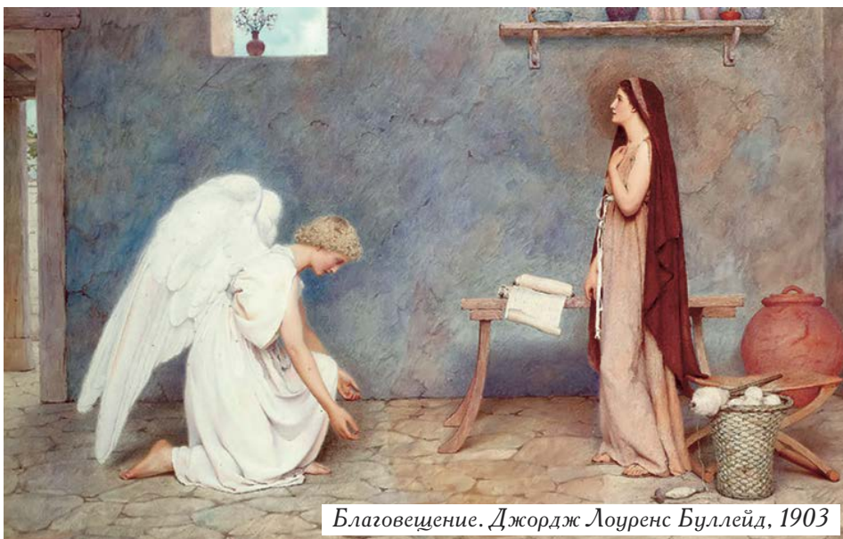
Благовещение. Джордж Лоуренс Буллейд, 1903

Патриарх Кирилл: «Христос воскрес!» - впервые это воззвение прозвучало из уст жен-мироносиц во мраке глубокого уныния, которыми были охвачены ученики после распятия Спасителя. Казалось, все надежды, которые ученики возлагали на Господа, рухнули: Тот, в Ком они видели Мессию, Избавителя, не только не установил чаемого народом земного царства, но и потерпел, казалось, полное поражение, был предан, как какой-то преступник, мучительной и позорной казни у всех на глазах. Казалось несомненным, что победа осталась за силами ненависти и насилия, что бичи и железо, смерть и отчаяние - реальны, а надежды на Бога - нет. Страшный опыт, который пережила Церковь в XX веке, в России и во многих других странах, когда торжество богоборческих сил казалось полным, а верные - обреченными на окончательное истреб-