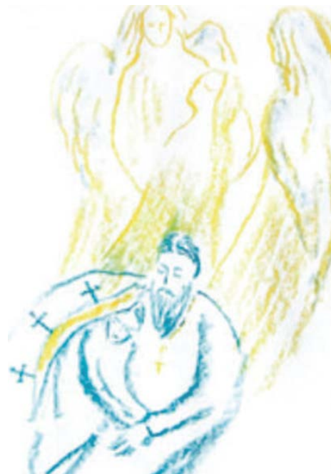
Рисунок Анны Леон