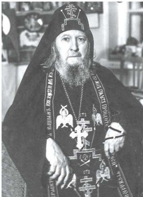
Народный утешитель, подвижник веры и благочестия, старец Свято-Успенского монастыря