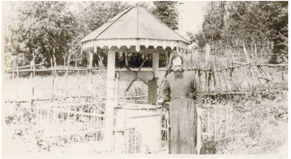
Отец Феодор у колодца в Медведово, славящегося чистойшей, вкусной и целебной водицей. 1990-е годы

Но отец Феодор молился и продолжал вынимать тяжелый грунт, веря в по-