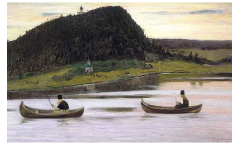
М.В. Нестеров. «Молчание»

Много говорить небезопасно ведь не только оттого, что внимание трудно сохранять и посему «во многословии не избежишь греха» (Притч. 10: 19). Преподобные Варсонофий Великий и Иоанн Пророк объясняют своему ученику, впоследствии известному всему христианскому миру наставнику аскетической жизни, в то время еще не авве, а просто Дорофею: «Ты так много говоришь только потому, что не познал еще, какой это приносит вред». Какой? Помимо выше приведенного объяснения из