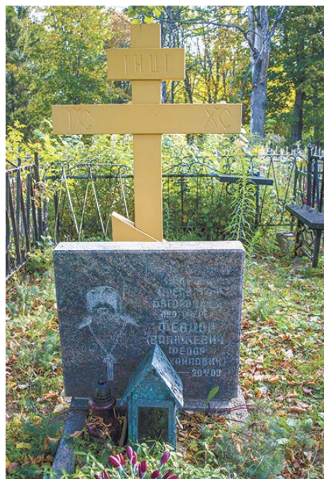
Могилка почитаемого народом Божиим отца Феодора на церковном кладбище

Вот уже 20 лет батюшкина могилочка почитаема народом Божиим. Своей жизнью, верою, служением Господу и людям он свидетельствовал о Боге. Народ молится у батюшкиной оградки - и чувствует тихую и светлую духовную радость, словно получает весточку из неведомой Вечности. Сюда приходят и приезжают люди с бедами, скорбями, нестроениями в семье, чтобы попросить батюшкиной молитвенной помощи, ходатайства пред Господом, Пресвятой Богородицей, Которые могут избавить от зла,