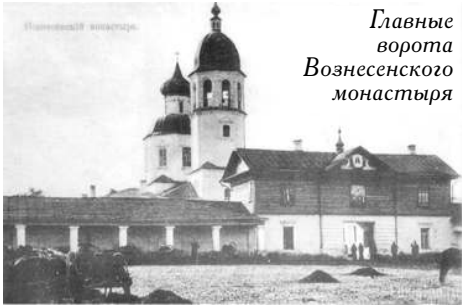
Главные ворота Вознесенского монастыря