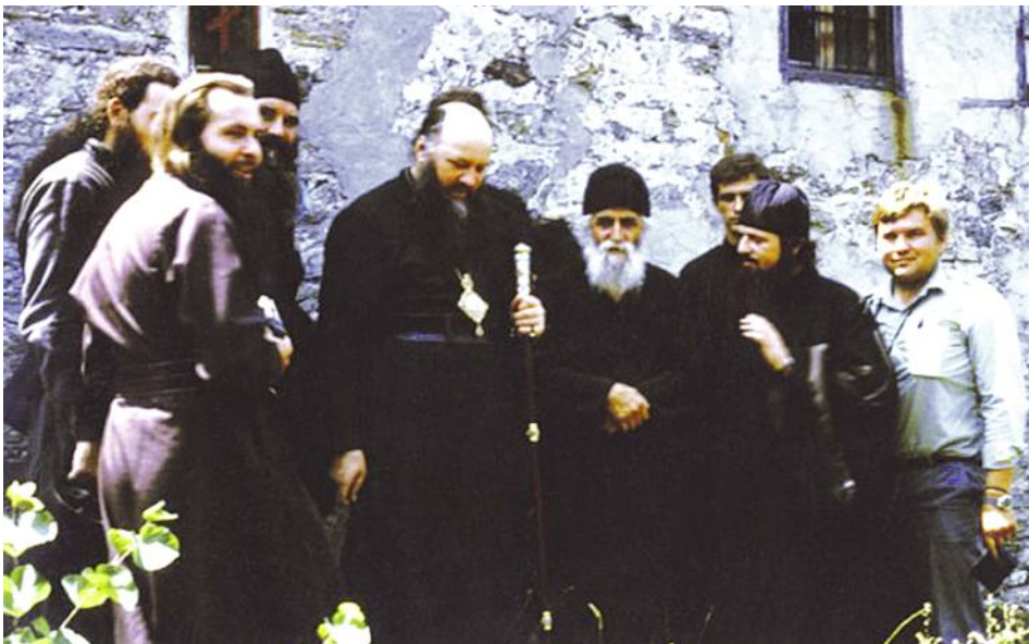
Святой Паисий Святогорец с паломниками из Украины

«Вы же, Владыка, помните, — говорит, — какая была история у нас. И вот я отказался переходить в Киевский патриархат. Тогда староста сказал: «Все, я вот привез священника Киевского патриархата, ты сдавай документы — и на