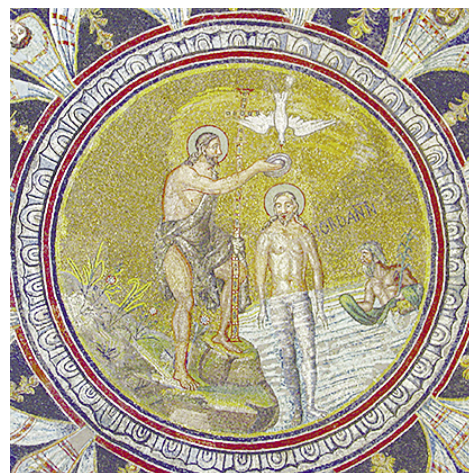
Крещение Господне. Равенна, Италия. V в.

Почему же Иисус не гнушается человеческой греховности? Казалось бы, Ему должно было бы быть невыносимо среди человеческих страстей, подлости, лицемерия, разврата и нечестия - Ему, Единственному чистому и безгрешному? По крайней мере, когда мы оказываемся в среде, которая по сравнению с нами вполне может быть названа грешной, нам неизбежно становится очень плохо, мы ощущаем себя «не в своей тарелке» и торопимся оттуда удалиться. Мы боимся, что нас могут каким-то образом «заразить» грехом, подтолкнуть к преступлению наших священных границ, подвергнуть сомнению наши незыблемые принципы и безуслов-