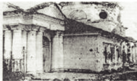
Казанская церковь в 1945 году

Казанский поход царя Иоанна Грозного напоминал крестный ход. Его целью было не столько покорение, сколько приведение ко Хранителям церкви - большевикам - пришлось обратиться за помощью все к той же иконе Казанской Божией Матери. Вот как это произошло.