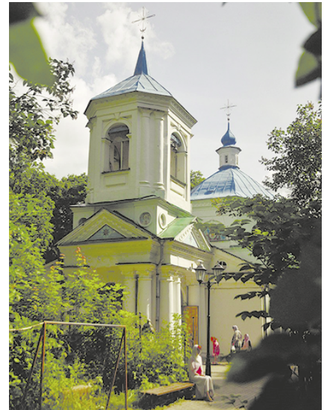
Церковь в честь Казанской иконы Божией Матери. Великие Луки

Во всем он видел доброе, хорошее - в людях, в жизни, в природе. И за все благодарил Бога. «Слава Богу за все! Слава