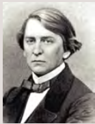
Плещеев Алексей Николаевич