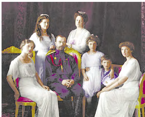
Император Николай II, императрица Александра Федоровна, великие княжны Татьяна, Ольга, Мария, Анастасия и цесаревич Алексей

Царственные страстотерпцы, царственные мученики - так после причисления к лику святых Русская Православная Церковь называет последнего российского императора Николая II и его семью: императрицу Александру Федоровну, царевича Алексея, великих княжон