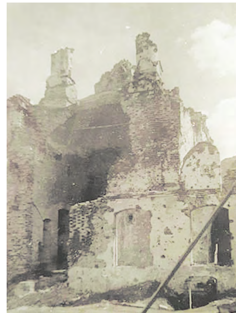
Разрушенный храм Живоначальной Троицы в Сергиевском монастыре (фото И.С. Николаева, 1945 г.) Из фонда В.Н. Лугашева

Хочется верить, что эта локальная победа не будет забыта, тем более что она досталась нам очень дорогой ценой. В каком-то смысле, мы до сих пор расплачиваемся за нее, ведь после штурма монастырские церкви и здания оказались практически полностью разрушены. При обследовании экспертная комиссия установила следующее: «В северо-восточном углу двора <...> были места захоронений именитых великолукчан в склепах, с массивными чугунными и или каменными надгробными плитами. В этом месте при осмотре оказались окопы и траншеи. Остатки плит не обнаружены. Собор - квадратное в плане массивное здание, перекрытое сомкнутым сводом, поддерживающим пять декоративных главок с кокошниками (Храм Живоначальной Троицы - О.Я., С.П.). С востока к собору примыкала одна апсида во всю ширину здания, с запада - притвор и восьмигранная колокольня. С юга и юго-восточных сторон собор был застроен другими зданиями».