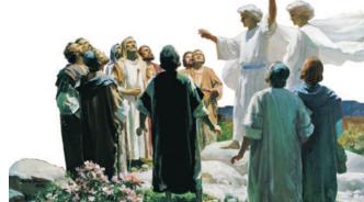
Вознесение Господне. Гарри Андерсон. 1976

из вида их. И когда они смотрели на небо, во время восхождения Его, вдруг предстали им два мужа в белой одежде и сказали: мужи Галилейские! что вы стоите и смотрите на небо? Сей Иисус, вознесшийся от вас на небо, придет таким же образом, как вы видели Его восходящим на небо (Деян 1:9–11).