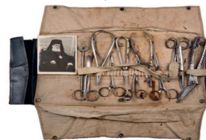
Хирургические инструменты епископа и хирурга Луки (Войно-Ясенецкого)

цированных огнестрельных ранениях суставов» (1944). 130 000 рублей из полученных денег святой доктор отдал на помощь детям-сиротам, жертвам фашизма. Остальные деньги тоже раздавал тем, кто в них нуждался, - беднякам, больным, малоимущим коллегам-медикам. ф.