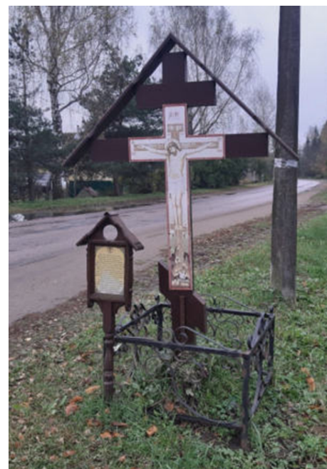
Поклонный крест на месте разрушенной Церкви Нерукотворного образа Господа Иисуса Христа, д. Максимово (Великолукский район)