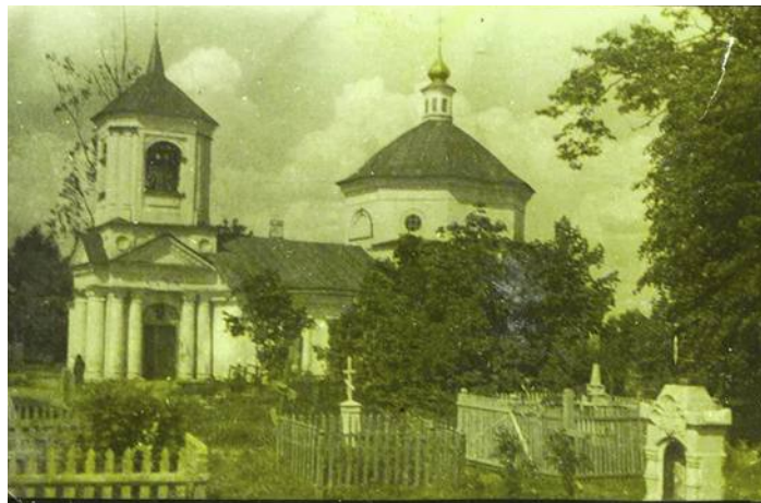
Казанская (кладбищенская) церковь 10-11 августа 1949 г.