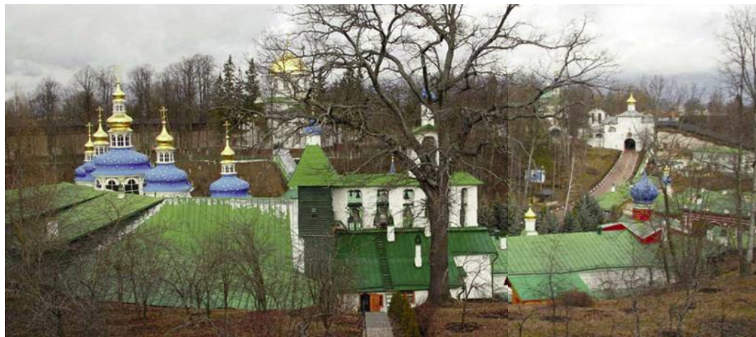
Псково-Печерский монастырь.

- Мне тяжелее всего сознание, что - несмотря на то, что я абсолютно убежден в правоте принятого решения, - наши прихожане, и понимающие, и не понимающие, так переживают без храма... И я бы хотел от всего сердца попросить у них: простите меня, особенно псковичи, что в этой ситуации единственным выходом - ради Бога, ради Церкви, и ради людей, ради сохранения паствы Христовой - было объявить,