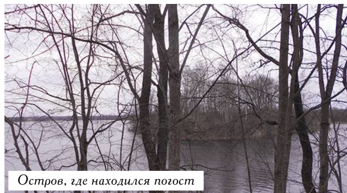
Остров, где находился погост