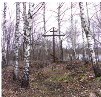
Поклонный крест, установленный на месте разрушенного Храма во имя Успения Пресвятой Богородицы на погосте Колобаки

И все двадцать верст икону несли на руках, и приносили ее в город в субботу, на пятой неделе после Пасхи, значит, в мае - начале июня. Многолюдная процессия с иконами, хоругвями, с зажженными свечами, пением и прочими атрибутами Крестного хода вначале шла в крепость, в Воскресенский собор, где служили по этому поводу молебн, а затем, в течение недели, икону носили по городу, по домам. Прихожане верили, что икона Успения из Колобак, если она побывала в доме, защитит его от пожара, болезней и других напастей...»