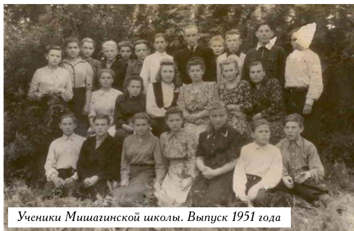
Ученики Мишагинской школы. Выпуск 1951 года