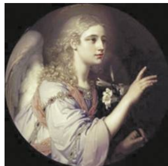
Благовещение. В. Боровиковский, 1809

великий мастер портрета, открывший целую эпоху в этом жанре. И вместе с тем Владимир Боровиковский создал несколько иконостасов. Художник происходил из семьи иконописцев и всю жизнь обращался к религиоз-