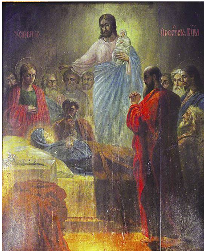
Икона во имя Успения Божией Матери.

Колюбакская церковь Успения Пресвятой Богородицы стала известной в округе благодаря древней чудотворной иконе Успения Божией Матери, любимой и почитае-