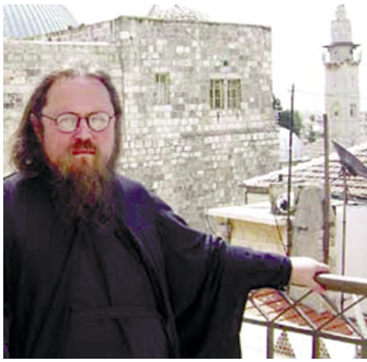
Протоиерей Андрей Куравов

Одно из самых тягостных зрелищ на свете - поминки, совершаемые атеистами. Вот все пришли домой от свежей могилы. Встает старший, поднимает рюмку... И в этот момент все просто физически ощущают, что что-то могут и должны они сделать для того, с кем только что они простились.