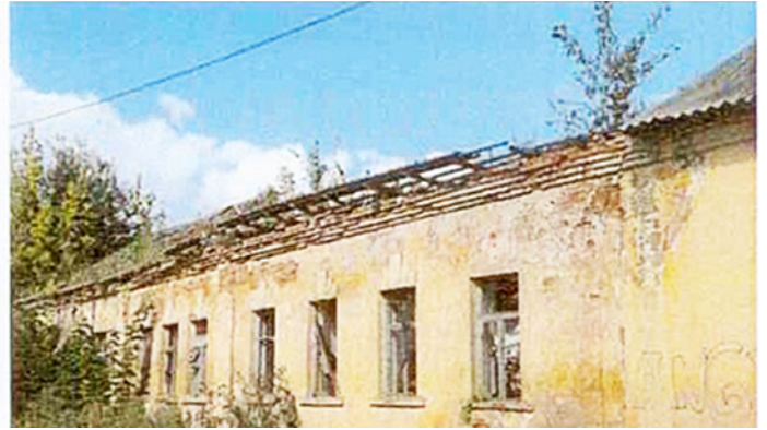
Разрушенное здание братских келий (2019 г.)

Начало XIX века было отмечено событиями Отечественной войны, которые коснулись и Великих Лук. Прежде всего, напомним, что в 1812 году на окраине города у д. Сеньково был заключен договор между Россией и Испанией о совместной борьбе против армии Наполеона.