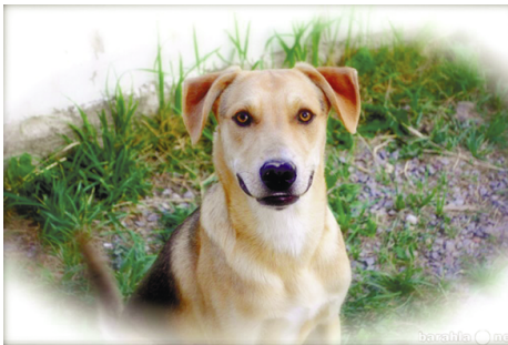
Трезор, спасший 16 ленинградцев от гибели

Общим любимцем двора был Трезорка - игривый и смысленный пес. Но в одно октябрьское утро в собачью миску, кроме воды, налить было нечего. Пес постоял, видно, подумал. И исчез. Жители вздохнули с облегчением - не