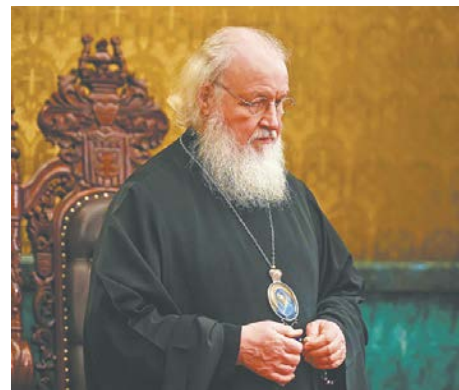
На утрени в Богоявленском кафедральном соборе в Елохове перед объездом Москвы с иконой Божией Матери «Умиление». 3 апреля 2020 года

Проявлять в жизни терпение очень непросто, каждый это знает. Даже в браке между любящими людьми: началась совместная жизнь — все радостно, но затем скорби, болезни, неудачи, естественное старение... Как же сохранить все то, что было в начале совместного пути? Не всем удастся сохранять чувства светлыми, чистыми, вдохновенными, оставаться верными друг другу, заботиться друг о друге. А ведь это и есть, согласно Евангелию, идеал совместной жизни. И, конечно, среди верующих много тех, кто так и живет, и радуется моя душа, когда я наблюдаю радостную семейную жизнь