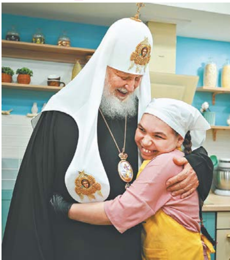
С воспитанницей Центра духовного и творческого развития «Перемена» в Казани. 18 мая 2023 года

Мы помним о подвижниках благочестия, которые иной раз на протяжении часов совершали поминовение на проскомидии, приходя для этого в храм задолго