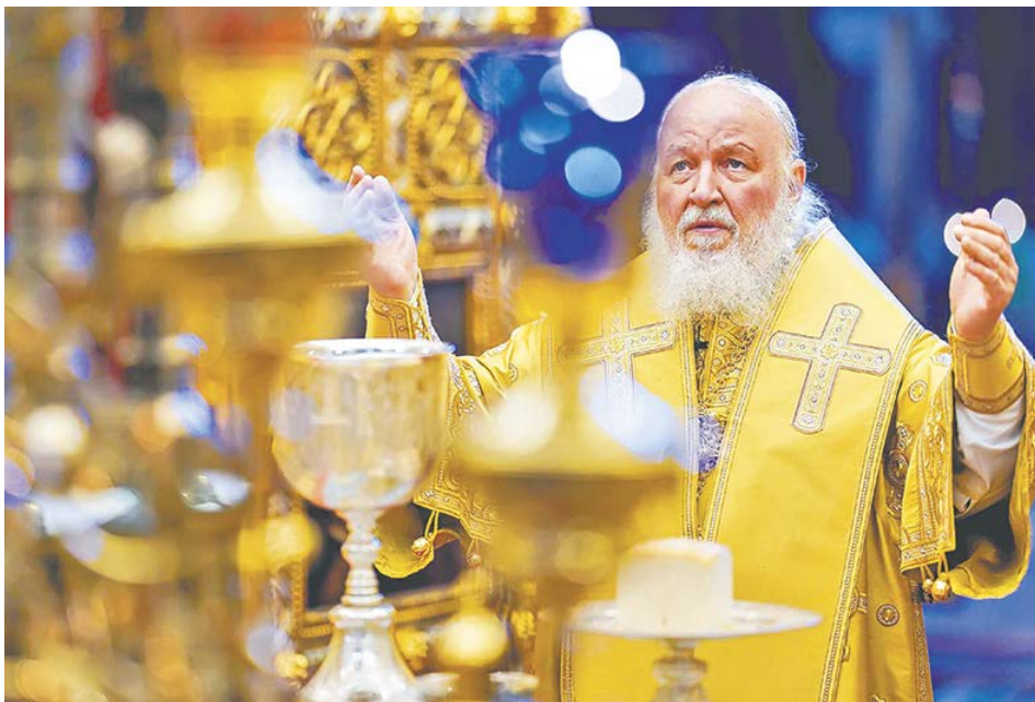
Богослужение в Храме Христа Спасителя в Москве. 3 сентября 2023 года

И вот женщина, приобретя драгоценнейшее миро, возлила его на главу Господа и Спасителя, и было смущение среди апостолов — все же понимали, что происходит нечто необычное. А Иуда, который был сребролюбом, даже дерзнул сказать: «Зачем такая трата?» Потом, видимо, опомнился и решил смягчить свое дерзкое слово: мол, можно же было миро продать