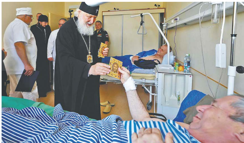
Посещение Центрального военного клинического госпиталя им. А. А. Вишневского в Красногорске. 21 июня 2022 года

Современный человек почти разучился терпеть. Многое дается так легко, как не давалось предыдущим поколениям; нас окружает комфорт, о котором и мечтать не могли наши отцы и деды. Все это, конечно, расслабляет нашу волю и нашу способность терпеть другого человека. Но ведь в Слове Божием нет ни капли лжи — одна только правда. Значит, и в заповеди «терпением стяжите души ваши» — правда Божественная и правда жизни.