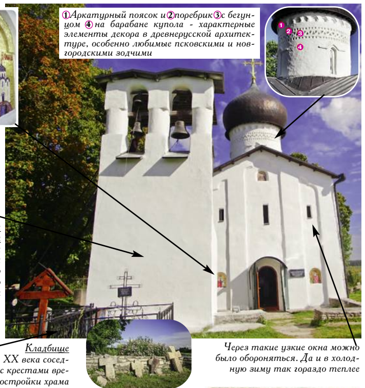
Кладбище Захоронения XX века соседствуют здесь с крестами времен постройки храма