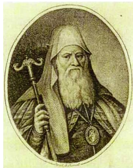
Митрополит Новгородский, Великолуцкий Димитрий (Сеченов) (гравюра А.А. Осипова)

Кроме новой церкви, в монастыре появляется большое количество жилых и