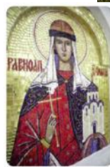
Одна из трех мозаичных икон западной стены Ильинского

Один из огромных камней времен ледникового периода недалеко от Ильинского храма. По преданию, на нем сохранился отпечаток стопы княгини Ольги. Подобные камни - не редкость в этих краях. В 1930-е храм Ильи Пророка в Выбутах закрыли, церковь святой Ольги (1914) разрушили. А камень-следовик взорвали. Сейчас на его месте установлен памятный знак в виде пирамиды из валунов, увенчанный крестом.