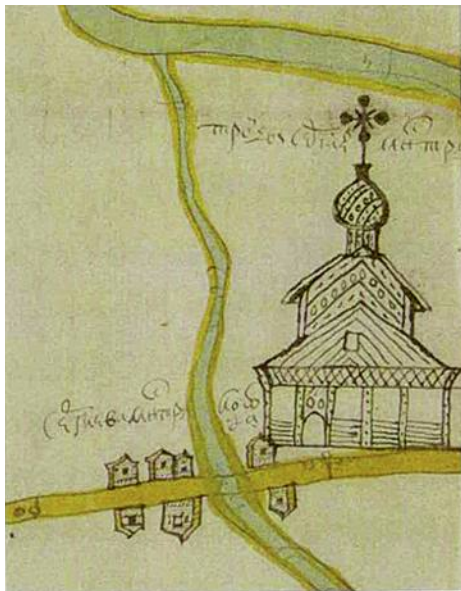
Церковь на плане земель Великолуцкого Троице-Сергиева монастыря 1699 г.

В середине XIX века И.М. Пульхеров отмечал уникальность этого храма благодаря небольшому ковчегу с 20 частицами от святых мощей: преподобного Сергия Радонежского, великомуч. Димитрия, Иакова Персианина, Феодосия Печерского, Ионы и Алексия, митрополитов Московских, преподобного Нила Столобенского, Герасима, Леонтия, папы Римского, муч. Иустины, великомуч. Аникиты, Михея ученика преподобного Сергия, Иллариона Иконийского, Мины, Мартирия, Иакова Боровичского, Киприана, Фомы, Потапия Римлянина. Также в нем хранились части древа Животворящего Креста Господня, камня и пелены Антония Римлянина. Эти святости появились в монастыре в 1715 году благодаря митрополиту Новгородскому и Великолуцкому Иову. В начале XIX века их собирались перенести из монастыря в Троицкий собор на центральной площади Великих Лук, но благодаря игумenu Иосифу они остались на месте «... для отвращения в верующих соблазна или, чего Боже храни, и самого возмущения». Также с этого времени в монастыре устанавливается традиция крестного хода на 5 (18) июля — день обретения мощей преподобного Сергия Радонежского.