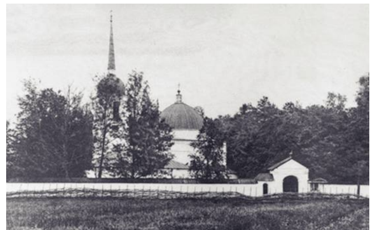
Успенская церковь (Коломенское (Успенское) кладбище)