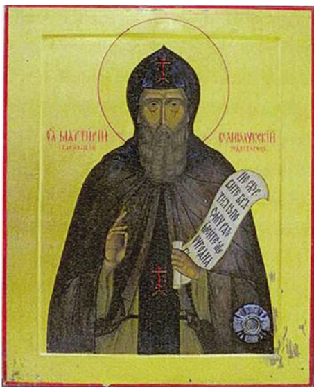
Икона преподобного Мартирия Зеленецкого и Великолуцкого чудотворца (хранится в Свято-Вознесенском кафедральном соборе г. Великие Луки)