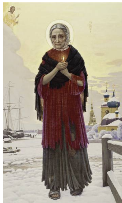
Блаженная Ксения - ангел Петербурга

ем блаженной. В том же году я начал роспись храма блаженной Ксении Петербургской, который был построен на Лахтинской улице, на которой она жила. В 2019 году, 6 июня, этот новый храм был освящен и открыл двери для верующих.