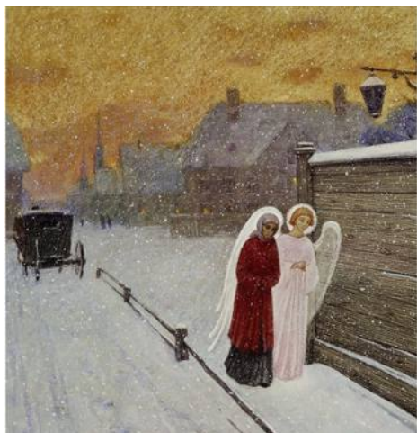
Вечер тихого дня

Это было двадцать лет тому назад. С тех пор я написал более полусотни картин, посвященных блаженной Ксении. В 2015 году вышел мой альбом живописи «Блаженная Ксения Петербургская», куда вошли все эти работы. В 2017 году на Камской улице, рядом с воротами Смоленского кладбища, был создан музей Ксении Петербургской. Экспонатов там почти нет - от блаженной Ксении ничего не сохранилось, у нее же ничего не было. Вот и приняли решение развесить по стенам музея репродукции моих картин, к которым я сделал поясняющие тексты. Получилась экспозиция, знакомящая паломников с жити-