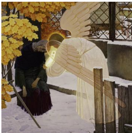
Ангел, принимающий душу блаженной Ксении Петербургской