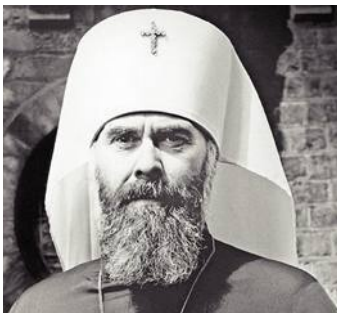
Митрополит Антоний Сурожский: