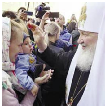
28 апреля 2019 года, Пасха Патриарх Кирилл посещает пациентов Детской Морозовской больницы, Москва.

Самое главное <для священнического служения> - работа священника над самим собой. Самое главное - никогда не привыкать к своему пастырскому служению, не превращаться в машину, которая стереотипно отвечает на вопросы, задаваемые священнику. И если пастырское чувство сохраняется сильным,