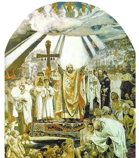
Крещение Руси. Виктор Васнецов. 1885-1896

Новгороде в пору крещения произошел какой-то конфликт. Конфликт настолько локальный, что он веками оставался предметом только устных преданий. Там, где крещению действительно противились, как в Ростове или в Муроме, Владимир откладывал его до лучших времен, а не посылал дружинников штурмовать непокорные города».